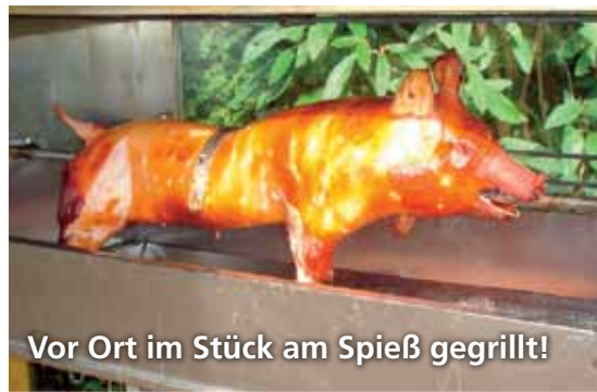
Vor Ort im Stück am Spieß gegrillt!